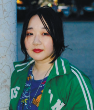
もりのえり 【劇団まんまる】